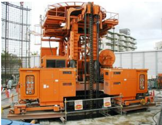
BMX低空頭掘削機全景