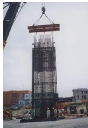
先行エレメント鉄筋籠の例